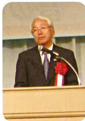
井戸敏三知事からのご祝辞